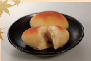
徳美乃や スイートポテト