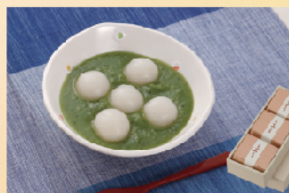
丸丸菓子舗 「くるみもち」(3個入り)