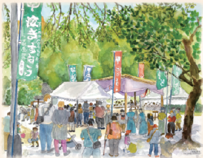
秋原神社「立きすもう」

【会期】 11月2日(金)～11月9日(金) ※最終日は午後2時まで 【会場】 2F 研修室I