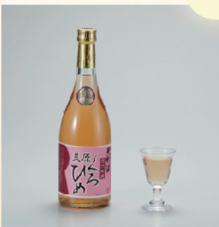
西條合資会社 天野酒 美原くるひめ

(ギフト箱入り) 720ml 2,500円 原料に55%に精米した山田錦100%を使用。堺で唯一の造り酒屋が自信をもってお勧めします。