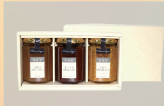
南千総 「ジャム・マーマレードの詰め合わせ3本セット」