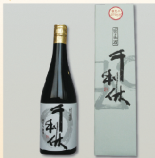
堺泉酒造(株) 千利休 純米吟醸酒

(ギフト箱入り) 720ml 2,500円 原料に55%に精米した山田錦100%を使用。堺で唯一の造り酒屋が自信をもってお勧めします。