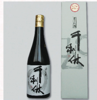
堺泉酒造前 千利休 純米吟醸酒 (ギフト箱入り) 720ml 2,500円 熟成期間を経て再度火入れしたお酒です。