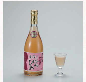
西條合資会社 天野酒 美原くろひめ 720ml 1,760円 古代米「アサムラサキ」で醸造した古代米酒です。